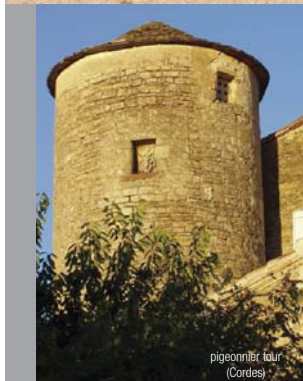
pigeonnier tour (Cordes)

Vous remarquerez la peinture blanche pour attirer les pigeons.