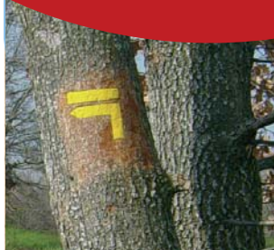
Vue de Souel