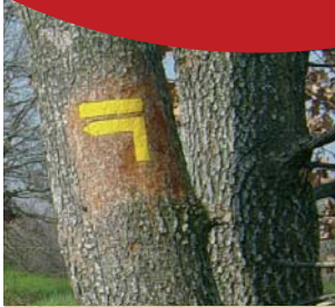
la chapelle Sainte Lucie